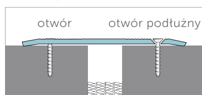
Cs dwustronnie otworowany